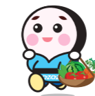
JA山武郡市 マスコットキャラクター 「さんぶのさんちゃん」

Sambugunshi Agricultural Products Magazine